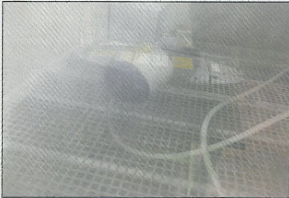
IP 6X (방진시험)