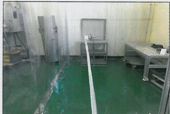
IP X6 (방수시험)