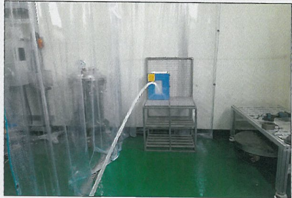
[그림 4: IP X5]