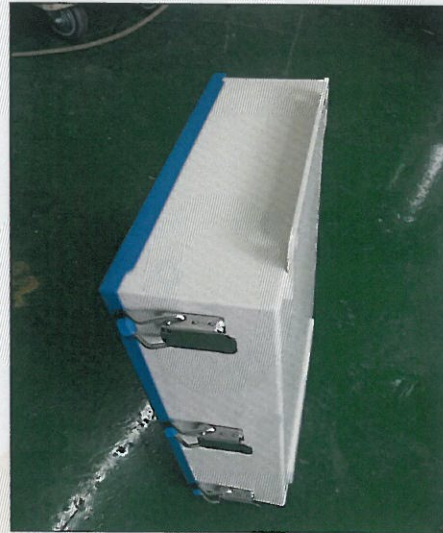
[그림 2: 측면]