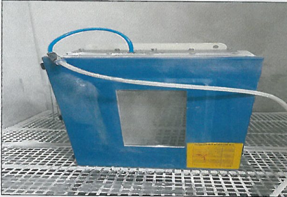
[그림 3: IP 6X]