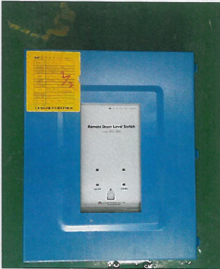
[그림 1: 전면]