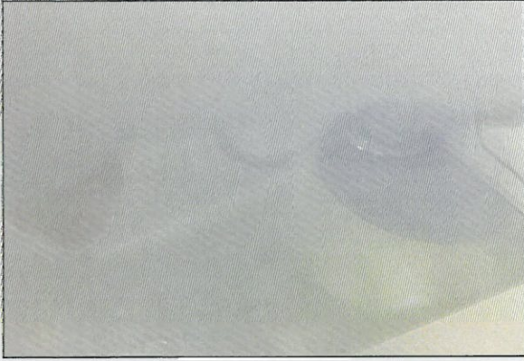
[그림 3: IP 6X]