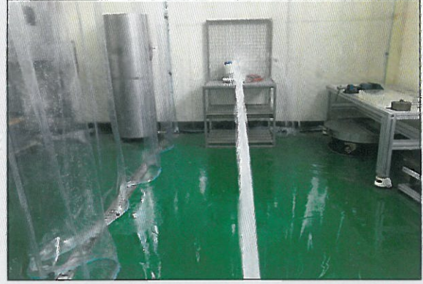
[그림 4: IP X6]