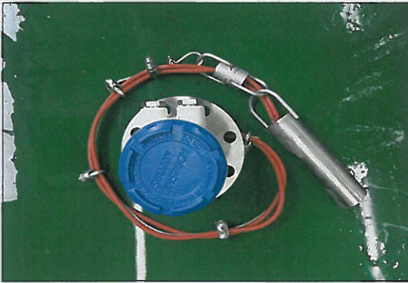
[그림 1: 전면]