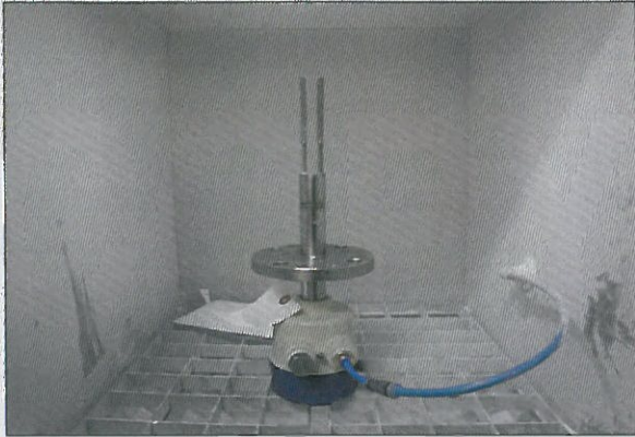
[그림 3: IP 6X]