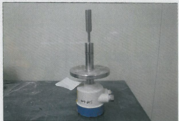
[그림 2: 측면]