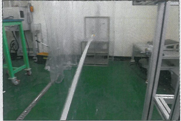
[그림 4: IP X6]