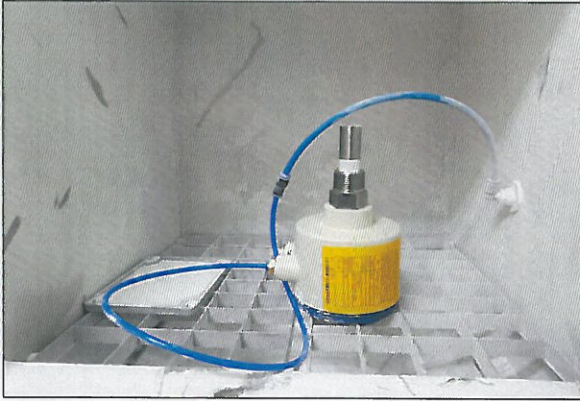
[그림 3: IP 6X]