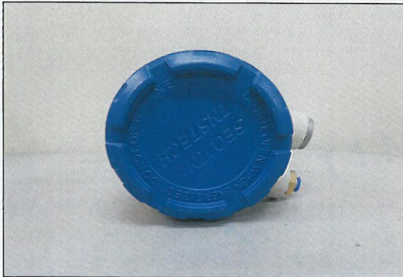
[그림 1: 머리부]