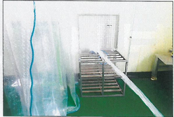
[그림 4: IP X6]