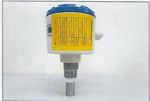
[그림 2: 측면]