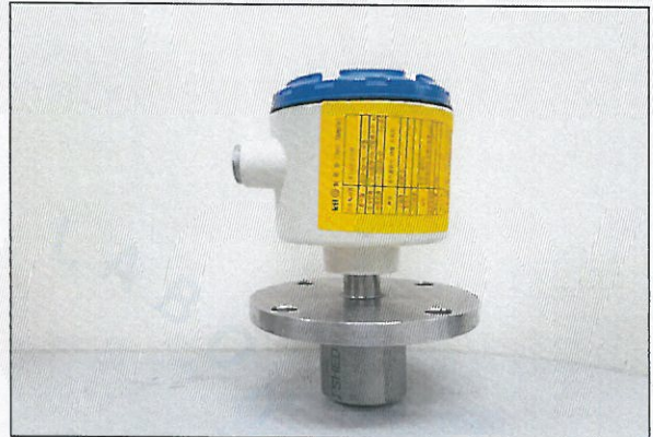
[그림 2: 측면]