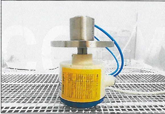
[그림 3: IP 6X]