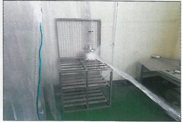
[그림 4: IP X6]