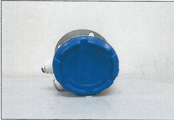
[그림 1: 머리부]